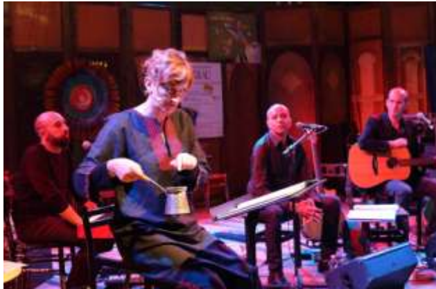
Compagnia del Suq e Radiodervish