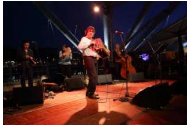
Ambrogio Sparagna e Orchestra Popolare Italiana