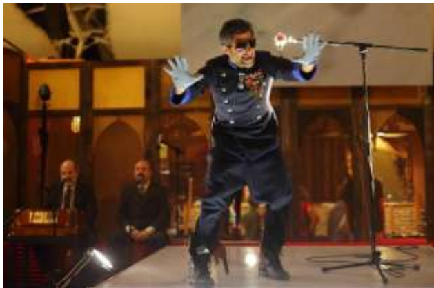
Teatro delle Albe

Il SUQ non é un luogo, é un'esperienza. Grazie delle emozioni! Vladimir Luxuria