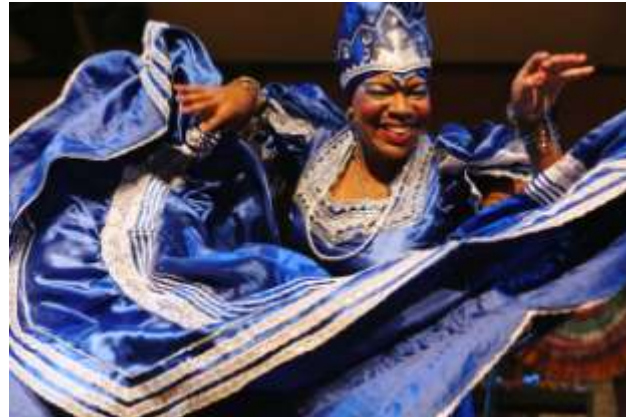
Danze al Suq