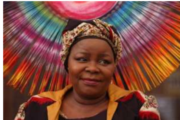
Nomatemba Tambo Ambasciatrice del Sudafrica