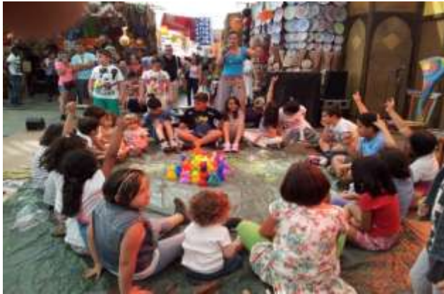
Laboratorio eco per bambini