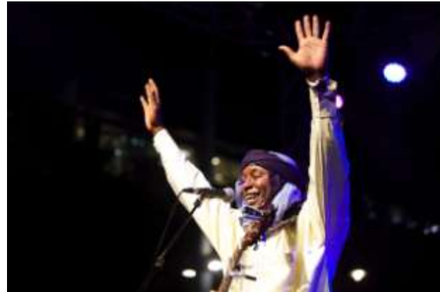
Hampâté et le Sahel Blues