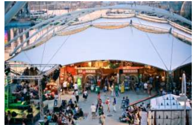
Ingresso del Suq