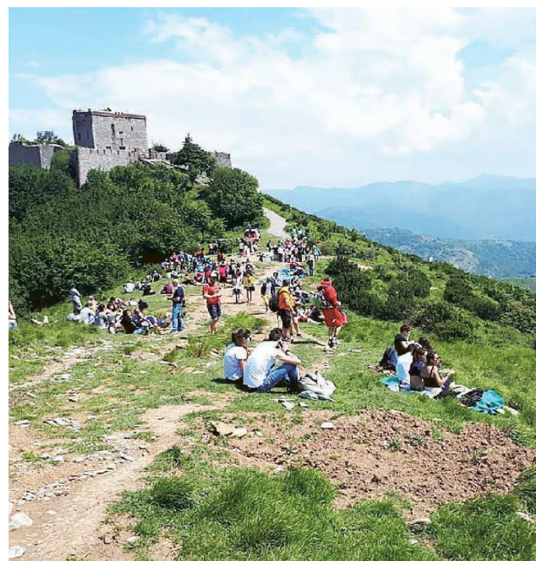
La MangiaForte unisce la passione per la natura a quella per il cibo

Il percorso, lungo all'incirca 10 chilometri, terminerà nel campo da calcio di Casanova di Sant'Olcese con l'ultima tappa gastronomica e la festa finale. Si tratta di una passeggiata senza grandi difficoltà, adatta anche ai "camminatori della domenica" e ai più piccoli. Si consiglia comunque di indossare un paio di scarpe da trekking per affrontare i vari tratti di sentie-