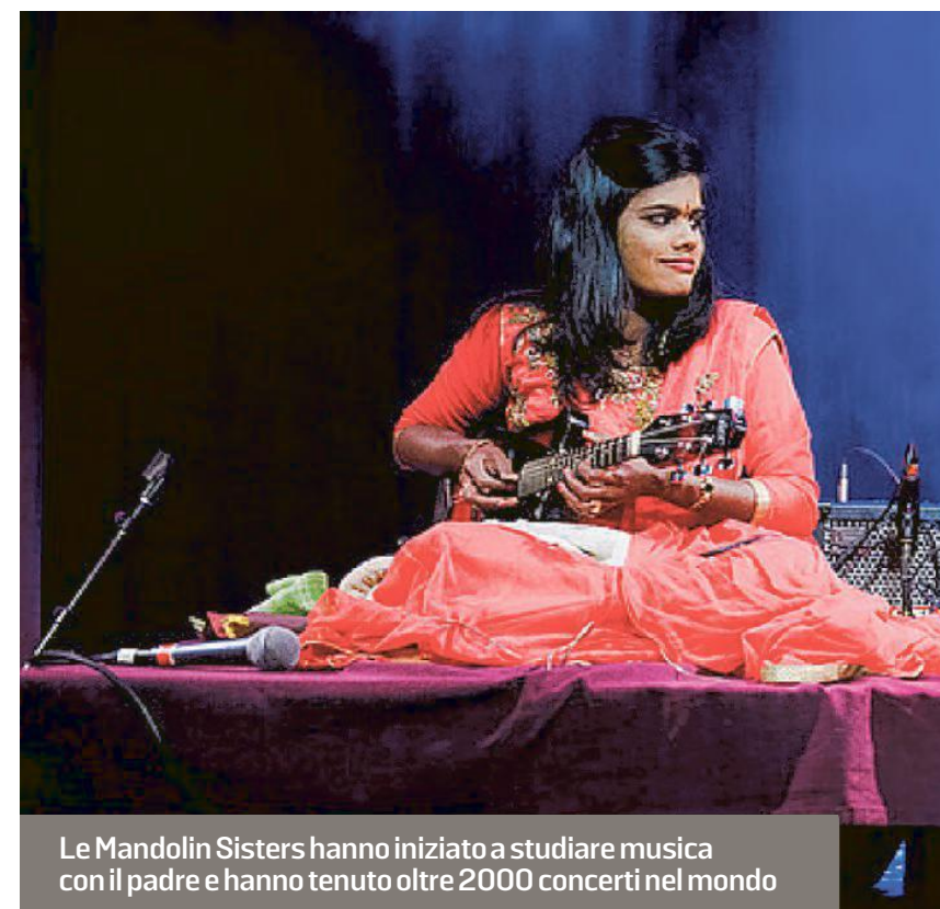
Le Mandolin Sisters hanno iniziato a studiare musica con il padre e hanno tenuto oltre 2000 concerti nel mondo

Molto ricche anche le ultime due giornate della rassegna, domani e lunedì. Domani alle 18 in piazza delle Fe-