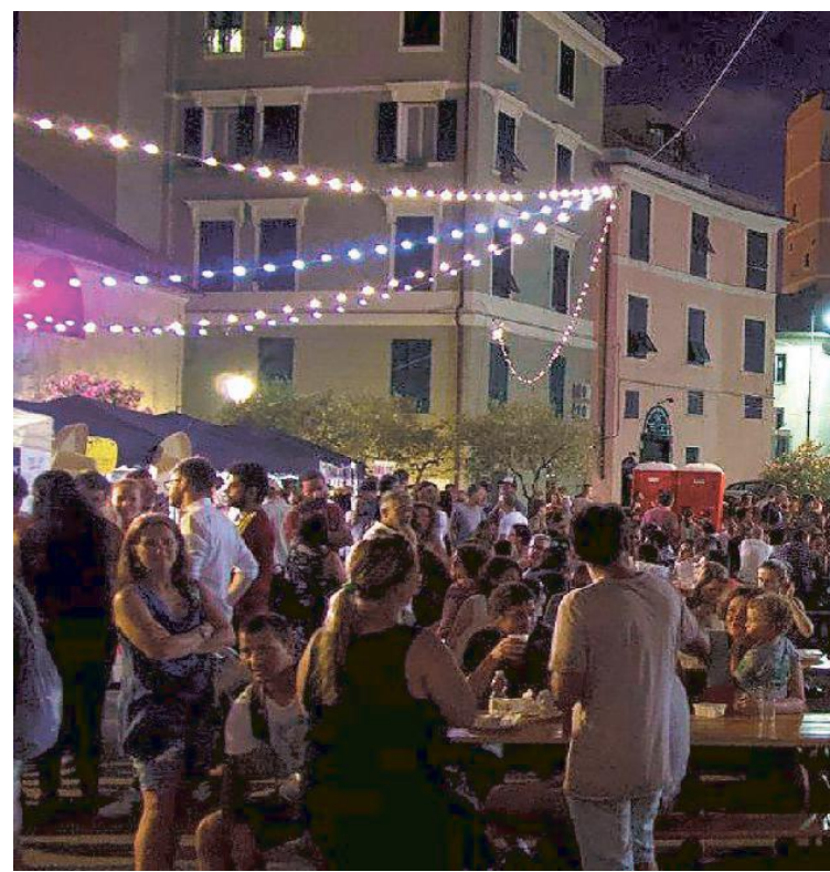
Il Braghetta Beer Festival si tiene in piazza Sarzano

Ogni serata si apre alle 18 e si chiude circa a mezzanotte e, per la prima volta si è scelto di dividere la rassegna su due weekend, visto il successo del passato. Grande novità dell'edizione