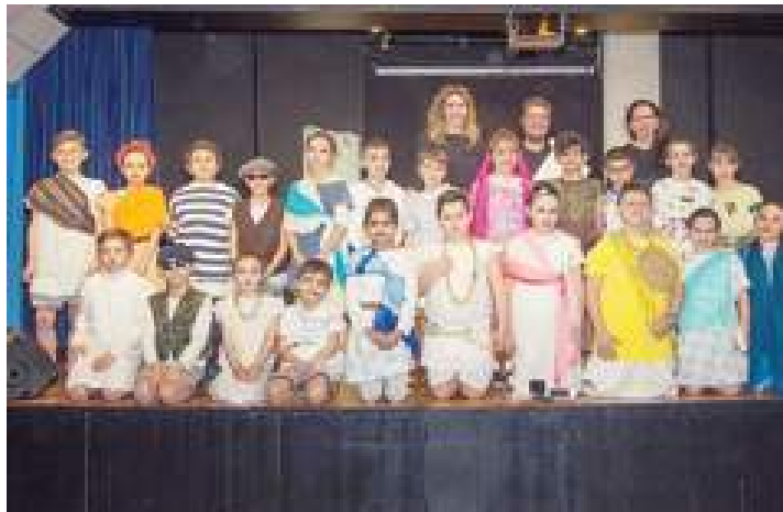
La quarta A della scuola primaria Solari